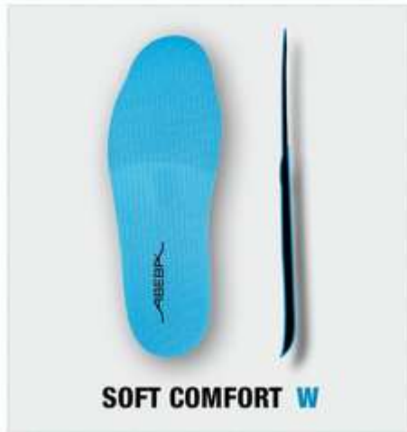
SOFT COMFORT W