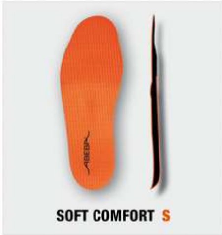
SOFT COMFORT S