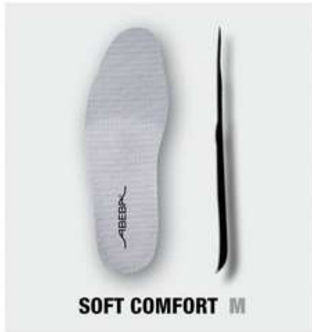
SOFT COMFORT M